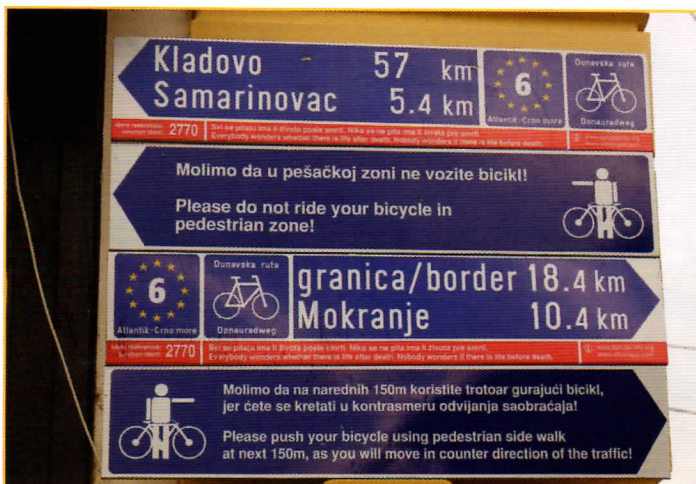
routebordjes in Servië

https://www.polarsteps.com/HaroldHulskers/1477363-all-the-way-to-the-black-sea